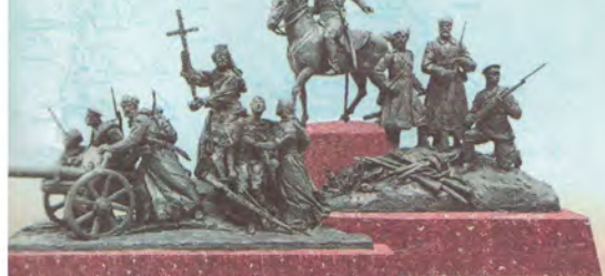
Москва. Фрунзенская набережная. Скульптурная композиция, посвященная героизму российских воинов (проект). 2014 г.

Государственное учреждение - Управление Пенсионного фонда Российской Федерации в городе Пласте Челябинской области