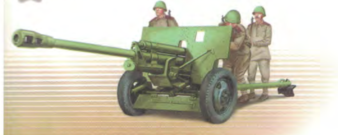
76-мм дивизионная пушка (ЗИС-3)